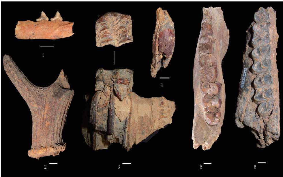
图 3 凤凰山地点发现的典型化石标本

似鸡骨山狐 ( Vulpes cf. chikushanensis )，编号 FH06-1001(图 3)，为左下颌骨残段，属一成年个体，残长 51mm。其上带有 p3 和 p4，下颌骨明显地窄长，前白齿窄而尖锐，