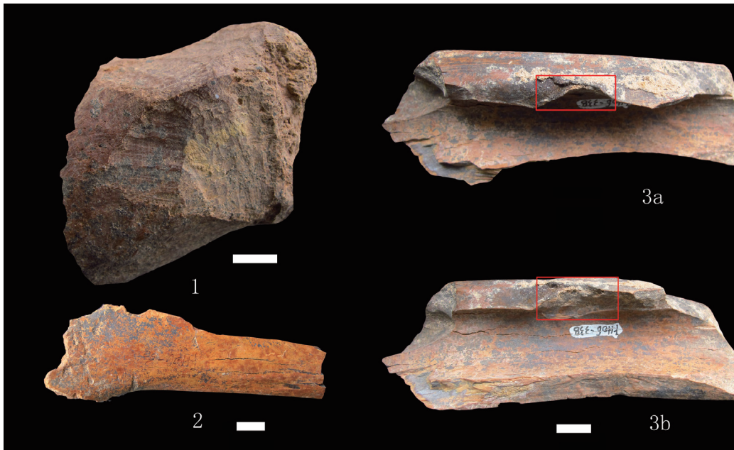
图 4 凤凰山地点出土动物骨骼表面痕迹